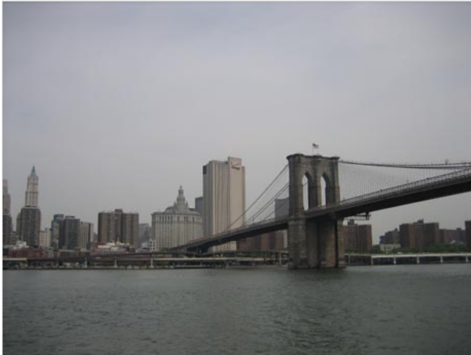
New York: Die Brooklyn Bridge

Besucherrekord in New York City: 23,5 Millionen Besucher kamen im ersten Halbjahr 2010 - 8,75 Prozent mehr als im Vorjahreszeitraum