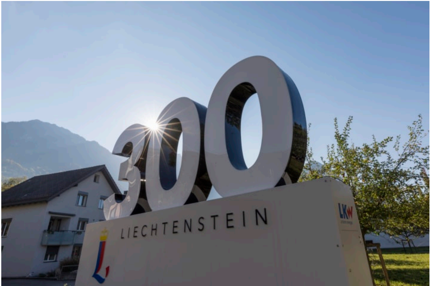
Das Fürstentum Liechtenstein wird 300 Jahre alt - Bild (c) Liechtenstein Tourismus

Das Fürstentum Liechtenstein begeht am 23. Januar 2019 seinen großen Geburtstag. An diesem Tag wird die Gründung des Fürstentums Liechtenstein vor 300 Jahren gemeinsam mit internationalen Gästen und der Bevölkerung gefeiert. Die Feierlichkeiten sind der Startschuss für Veranstaltungen und Ausstellungen, die während des Jahres stattfinden. Dazu gehören Ausstellungen im Landesmuseum und im Kunstmuseum, die Eröffnung des Liechtenstein-Weges sowie der Staatsfeiertag. Detaillierte Informationen zum Jubiläumsjahr sind unter www.300.li verfügbar.