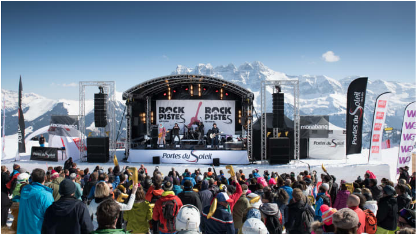
Festival Rock The Pistes in Champéry - Bild © JB Bieuville / Zur Verfügung gestellt von Schweiz Tourismus

Die Schweiz ist berühmt für ihre sommerlichen Festivals wie das Jazz Festival Montreux oder das Locarno Film Festival. Aber auch im Winter gibt es einige Festivals mit internationaler Ausstrahlung, und das sowohl in den Bergen als auch in den Städten. Von Lichtinstallationen und Kulinarik bis hin zu klassischer Musik, elektronischen Beats und Film - hier unsere Tipps zum Aufwärmen.